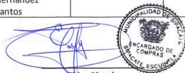
Elder Pineda Encargado de Compras