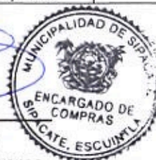
Elder Pineda Encargado de Compras